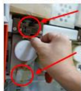
PXTシロップセンサー扉

①空のPXTを外します。PXTシロップセンサー扉を開け、液垂れを防ぐためチューブの先端を指で摘みながら、PXTチューブガイド、ピンチバルブ扉を開け、空のPXTを前に引き出す。PXTチューブガイド、ローラーに付着したシロップなどをふき取り、ピンチバルブ扉の内側に付着したシロップはブラシと水で洗浄し、アルコールスプレー殺菌をする。